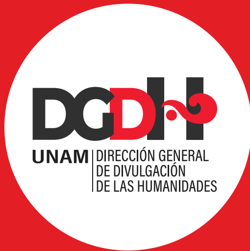
Imagen de perfil

Se recomienda poner atención al tamaño y proporción del isologo en la imagen de perfil y “moscas”; que no se recorte o que no quede deformado.